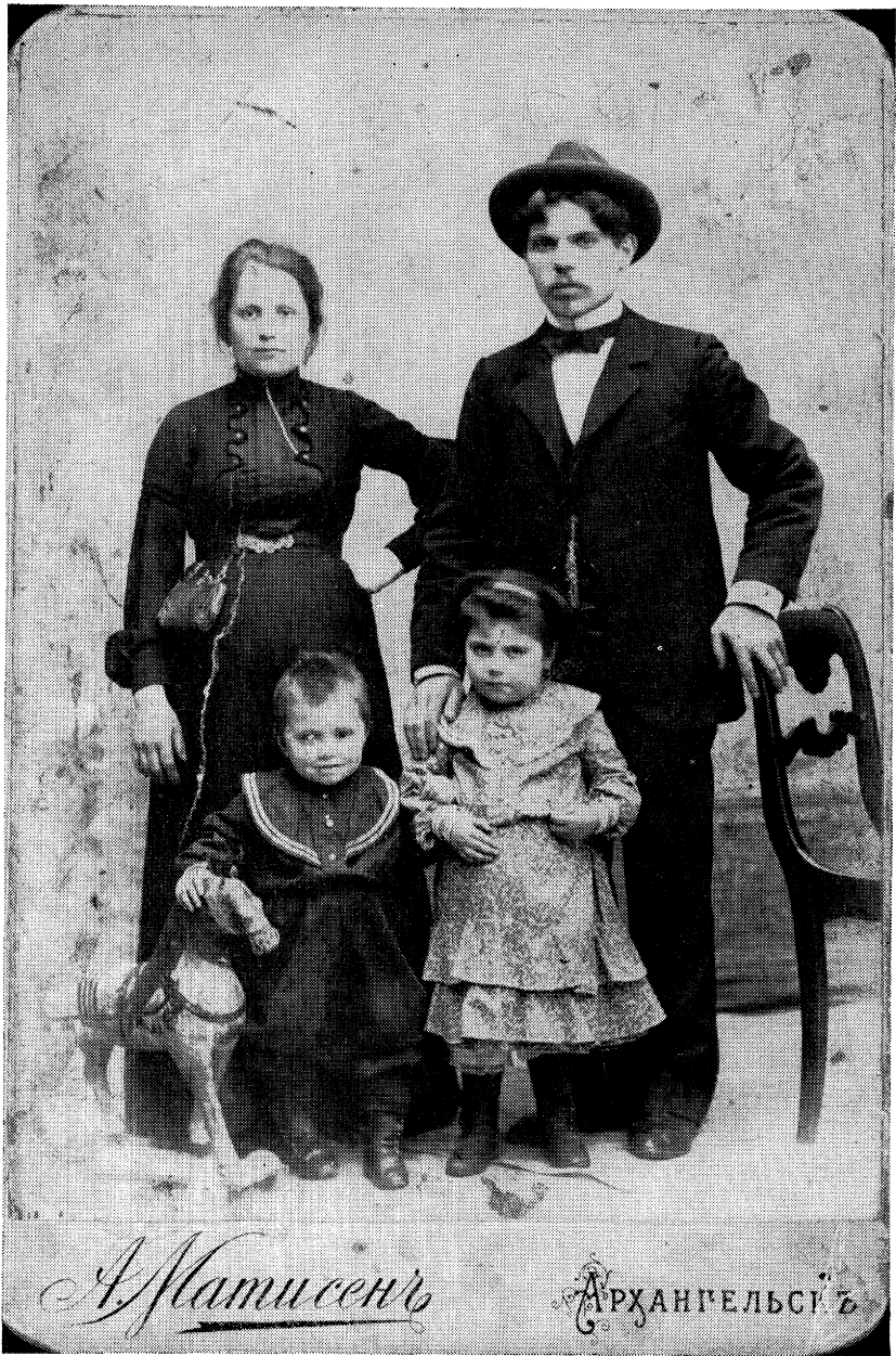
איך מיט מיין פרוי פרידע און קינדער אויף פארשיקונג אין סיביר